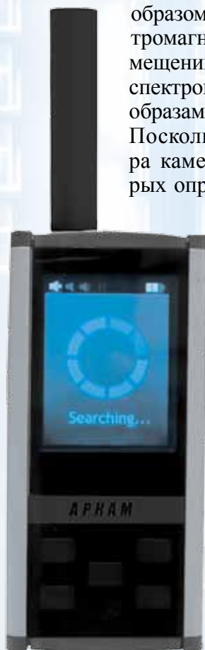
Рис. 3. Обнаружитель видеокамер «Аркам»